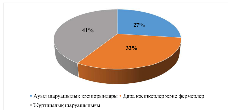
1-сурет. Қазақстан Республикасында 2020 жылғы ауыл шаруашылығы өнімдерінің кәсіпкерлік қызмет санаттары үлесі*

Жұртшылық шаруашылығы тұрғындарға қажетті азық-түлік өнімдерінің жалпы көлемін құруда басты орынды алады. Оның үлесі 2020 жылы 41%-ды құрады (сурет 1).