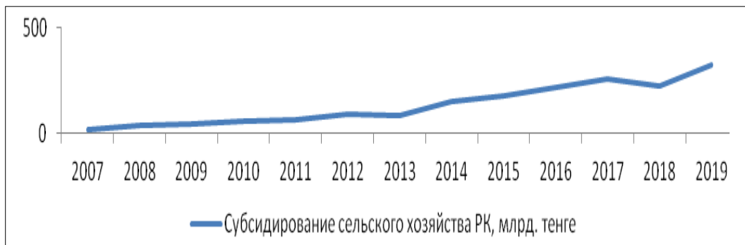
Рисунок 3. Субсидирование сельского хозяйства в 2007-2019 годах*

*Построен авторами на основе данных источника [7]