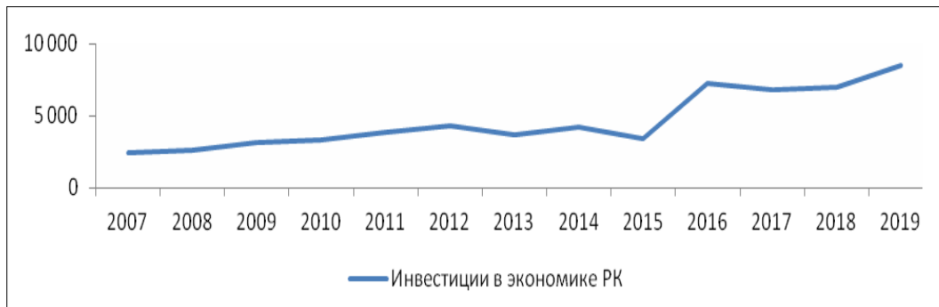
Рисунок 2. Инвестиции в сельское хозяйство Республики Казахстан, (млрд тенге)*

при внутренней нестабильности. Состояние и процессы развития отрасли определяют сельхозтоваропроизводители, как основные ячейки отрасли, как элементы финансовой и институциональной инфраструктуры. Однако эти элементы не могут функционировать отдельно и в отрыве от других секторов экономики. Государство направляя финансовые ресурсы активно поддерживает отрасль (рис. 3).