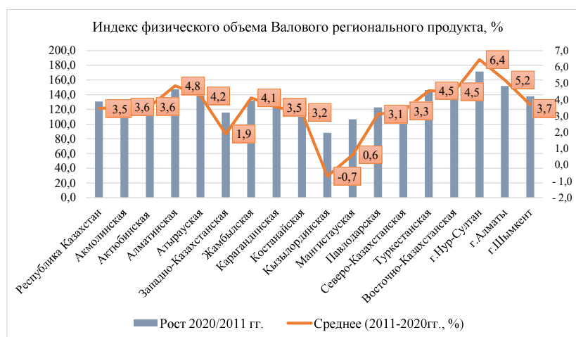
Рисунок 2. Индекс физического объема Валового регионального продукта, %*

высокие среднегодовые темпы развития экономики за последнее десятилетие показала столица нашего государства город Нур-Султан (6,4%). Также высокие темпы роста развития показывают г. Алматы (5,2%), Восточно-Казахстанская область (4,5%), Алматинская область (4,8%), Туркестанская область (4,5%), Атырауская область (4,2%). Наиболее низкие темпы развития за последнее десятилетие показали Кызылординская область (-0,7%), Мангистауская (0,6%), Западно-Казахстанская области (1,9%), возможно на темпы развития данных регионов отражается волатильность цен на нефтегазодобывающую продукцию в этих регионах, которая в последние годы была нестабильной и зависела от мировых цен на энергоресурсы на мировых товарных рынках.