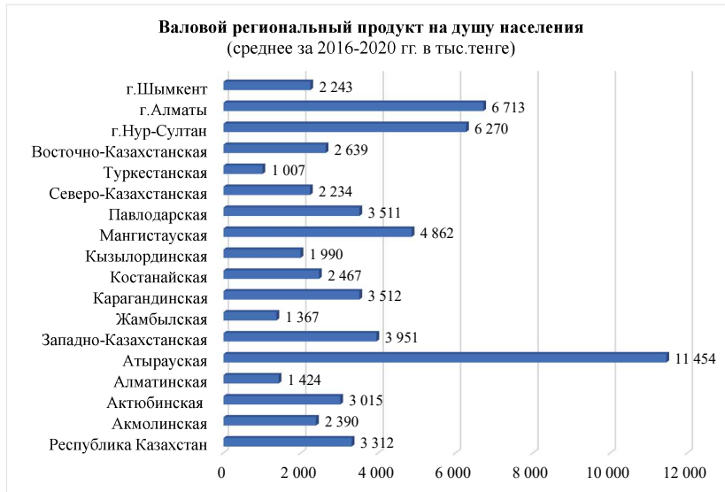
Рисунок 3. Валовой региональный продукт на душу населения в тыс. тенге в среднем за 2016-2020 гг.*

республики, и соответственно, с уменьшением ВРП на душу населения в среднем.