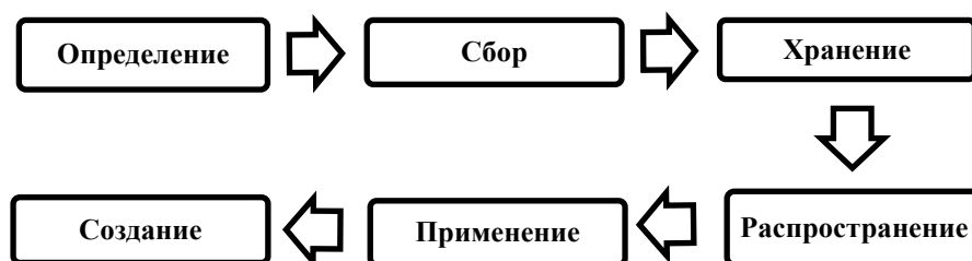
Рисунок –1. Элементы процесса менеджмента знаний *составлен авторами по источнику [14]

Менеджмент знаний фокусируется на сборе, хранении, распространении и использовании информации и опыта организации для достижения ее целей (Рисунок 1).