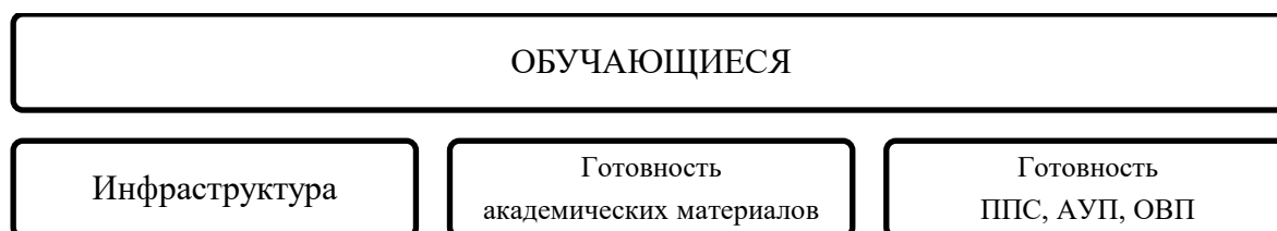
Рисунок – 4. Модель инклюзивной образовательной среды ВУЗа

Менеджмент знаний является составной частью менеджмента организации. Значимость менеджмента знаний при формировании модели инклюзивной образовательной среды (Рисунок 4) высока.