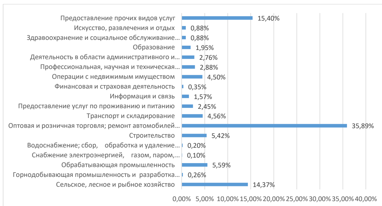
Рисунок 2. Структура предпринимательства по видам экономической деятельности, в %

При этом, доля субъектов МСП в разрезе по отраслям выглядит следующим образом: сельское хозяйство 14,37%; обрабатывающая промышленность 4,7%; строительство – 5,42 %, оптовая и розничная торговля занимает в среднем почти 35,89% (рисунок 2).