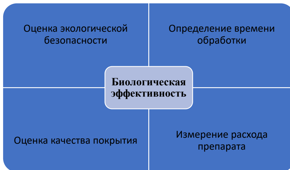
Рисунок – 1. Ключевые факторы, влияющие на биологическую эффективность

препарата безопасным для людей и объектов внешней среды способом. Поэтому большое значение с точки зрения биологической эффективности имеют следующие факторы: время обработки, качество покрытия, норма расхода препарата и его экологическая безопасность (рисунок 1).