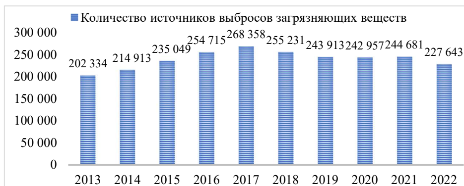
Рисунок 5. Количество источников выбросов загрязняющих веществ, ед.* * Составлен авторами на основе источника [11]

Количество источников загрязнения атмосферного воздуха за период с 2013-2022 годы также возрастает с 202,3 тыс. до 227,6 тыс. ед. или на 12,5%. Уровень выбросов жидких и газообразных загрязняющих веществ в атмосферу также вырос на 7,9%, составив в 2022 году 1868,5 тыс. тонн (2013 году – 1731,5 тыс. тонн, рис. 5).