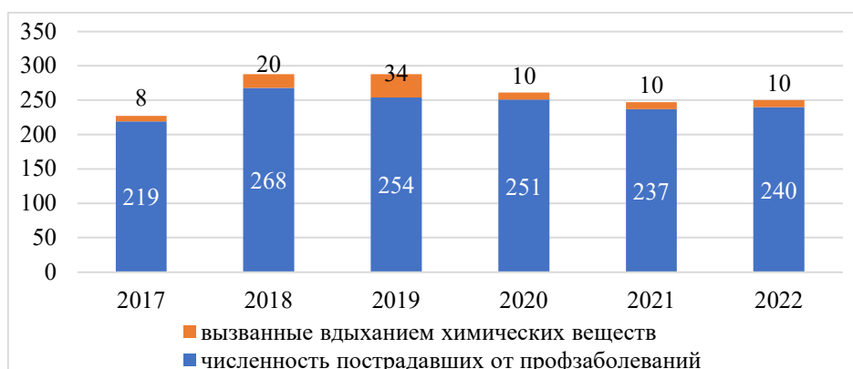
Рисунок 4. Число заболевших профзаболеваниями, чел.* * Составлен авторами на основе источника [11]

Статистика показывает, что бизнес в основном сосредоточен в крупных городах, таких как Караганда, Алматы, Усть-Каменогорск, Шымкент и Астана, где загрязнение воздуха является одной из проблем. Также наблюдается рост экологических заболеваний среди населения: количество профессиональных заболеваний за 2017-2022 годы не снизилось. Среди них большая часть заболеваний вызвана вдыханием химических веществ (рис. 4).