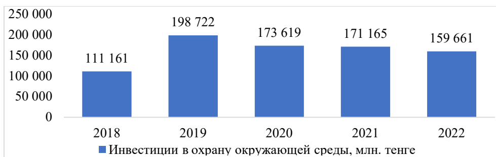
Рисунок 6. Инвестиции на охрану окружающей среды, млн. тенге* * Составлен авторами на основе источника [11]

Как показывает практика, все чаще приоритет отдается неэффективным методам, направленным на ликвидацию ущерба, а не на предотвращение негативного воздействия на экологию. Идет преобладание затратного подхода к решению проблем экологизации, отсутствует единый комплексный подход к предотвращению негативного воздействия на окружающую среду, что требует разработки единой экологической политики. Несмотря на положительную динамику роста объема инвестиций в основной капитал на охрану окружающей среды на 43,6% (с 111,2 млрд. тенге в 2018 году до 159,7 млрд. тенге в 2022 году) (рис.6), это никак не повлияло на число предприятий, применяющих экологические инновации (наоборот, произошло снижение почти в три раза за последние пять лет, всего 70 предприятий), доля экологических инноваций составила менее 0,2%.