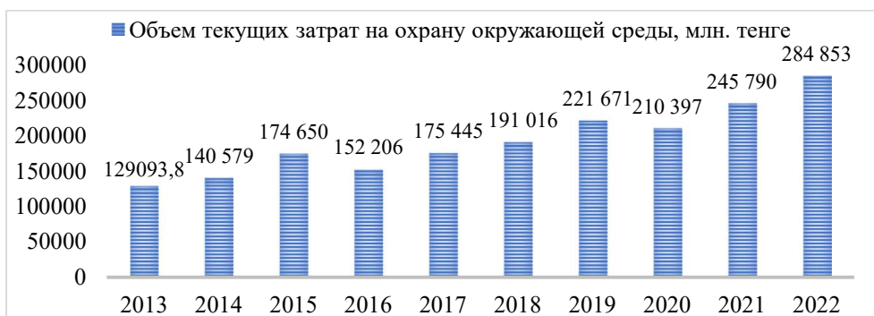
Рисунок 3. Динамика текущих затрат на ликвидацию загрязнений, млн. тенге* * Составлен авторами на основе источника [11]

Статистика показывает, что бизнес в основном сосредоточен в крупных городах, таких как Караганда, Алматы, Усть-Каменогорск, Шымкент и Астана, где загрязнение воздуха является одной из проблем. Также наблюдается рост экологических заболеваний среди населения: количество профессиональных заболеваний за 2017-2022 годы не снизилось. Среди них большая часть заболеваний вызвана вдыханием химических веществ (рис. 4).