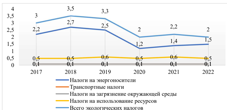
Рисунок 7. Доля экологических налогов в ВВП, %* * Составлен авторами на основе источника [11]

Поэтому только разработка и принятие программ производственного экологического менеджмента обеспечит соблюдение природоохранного законодательства. Инструменты административного регулирования, такие как экологические налоги и система мониторинга корпоративной деятельности, должны играть важную роль в защите окружающей среды. Экологические налоги, представляющие собой денежные выплаты компаниям за загрязнение окружающей среды или использование природных ресурсов, стимулируют сокращение выбросов загрязняющих веществ. Система мониторинга или контроля требует от компаний ответственности за их негативное воздействие на окружающую среду и поощряет внедрение новых безопасных технологий. Анализ показывает, что доля экологических налогов в ВВП Казахстана в 2022 году составила всего 2,0%, тогда как налоги на энергетику достигают более 70,6%. Отчисления предприятий за загрязнение окружающей среды, составляют лишь 0,1% ВВП (рисунок 7).