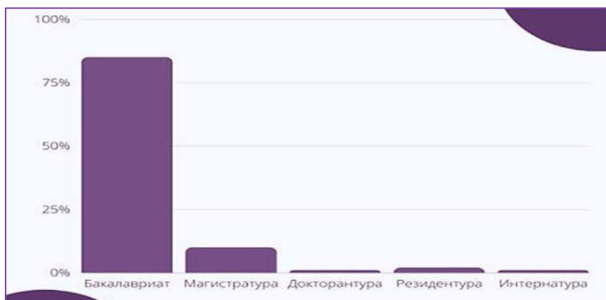
Рисунок 1. Доля обучающихся по академической мобильности в разрезе уровней образования, чел.*

Развитие виртуальной академической мобильности: С 2020 года в вузах Казахстана активно развивается виртуальная академическая мобильность обучающихся. Количество обучающихся, получающих дистанционное образование, составляет 1113 человек, в то время как 2500 человек обучаются в офлайн-режиме. Это указывает на то, что виртуальная академическая мобильность становится все более популярной среди студентов [10].