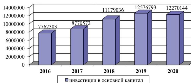
Рисунок 2. Инвестиции в основной капитал, млн тенге [6]

Анализ динамики развития инвестиций в основной капитал предприятий по республике за последние пять лет позволил установить, что средние темпы их роста и прироста составляют соответственно 152 % и 52 % (рис. 2).