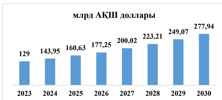
2-сурет. 2023-2030 жылдардағы әлемдік медициналық туризм нарығы көлемінің болжамы, млрд. АҚШ доллары

* [8] дереккөзі негізінде авторлармен құрастырылған