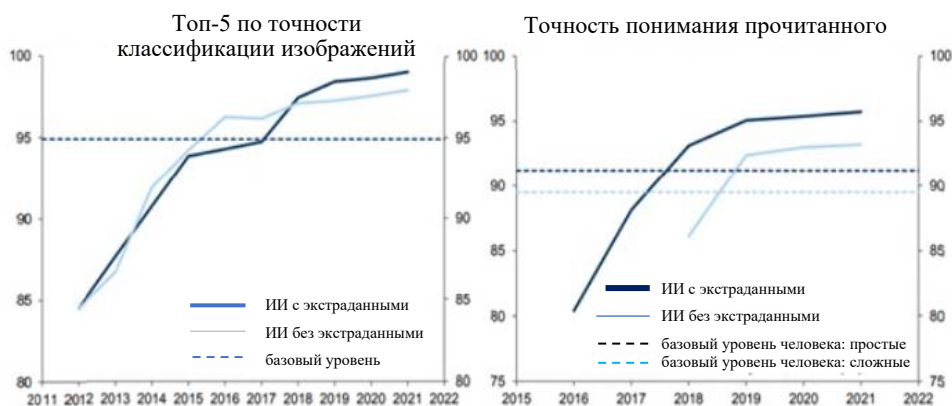
Рисунок 2. ИИ все больше превосходит человеческие тесты*

Например, последняя версия модели GPT OpenAI – GPT-4, которая была выпущена в марте 2023 года, демонстрирует значительный прогресс по сравнению с предыдущей версией, GPT-3.5, на которой основан ChatGPT. GPT-4 показывает улучшение результатов на тестах SAT на 150 баллов по сравнению с предшественником, что составляет приблизительно 40%. Теперь модель GPT-4 способна обрабатывать не только текстовый, но и визуальный ввод, что дополнительно расширяет её функциональность. Алгоритмы, лежащие в основе генеративного искусственного интеллекта, уже до этого времени превзошли человеческие показатели в таких задачах, как классификация изображений и понимание текста, что подтверждается на рисунке 2.