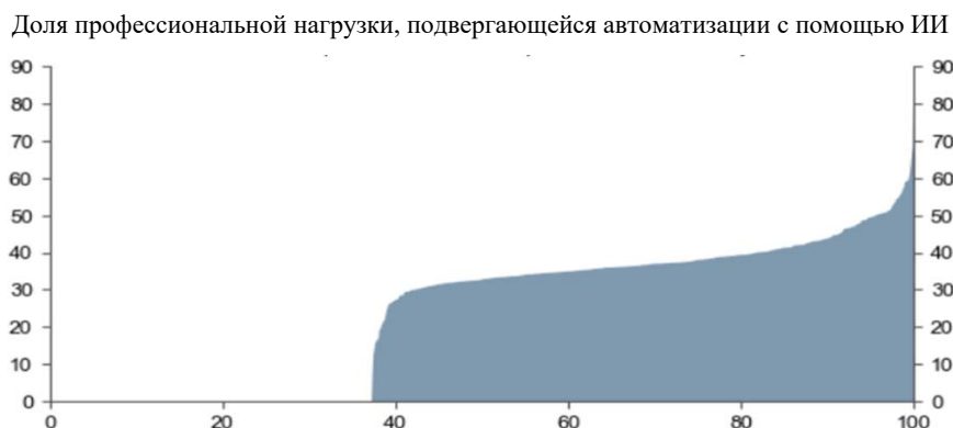
Рисунок 3. Две трети нынешних профессий могут быть частично автоматизированы с помощью ИИ*

Поскольку ИИ становится все более продвинутым и доступным, за ним последовали интерес и инвестиции. Управленческие команды публичных корпораций все чаще ссылаются на ИИ в отчетах о прибылях и убытках – и с быстро растущей скоростью – и эти признаки интереса предсказывают значительный рост капиталовложений на уровне компании (рисунок 3).