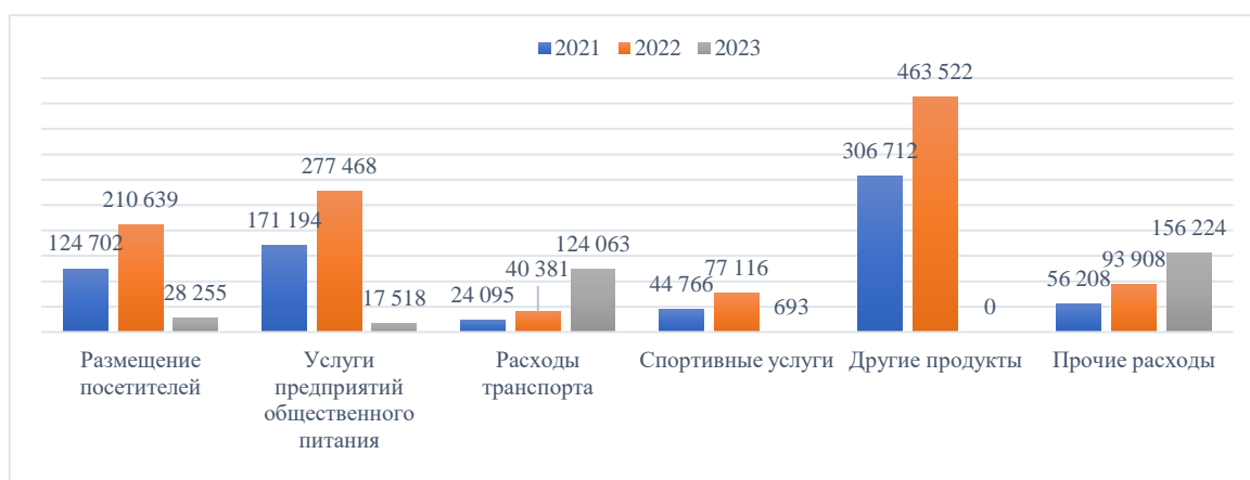
Рисунок – 1. Расходы, относящиеся к выездному туризму (млн.тенге)

Данные рисунка 1, согласно официальной статистике, наглядно показывают показатели уровня расходов по выездному туризму. Наиболее высокие расходы туристов по выездному туризму составляли в период 2022 году в сумме 1,163 трлн. тенге. Самые высокие расходы были в 2021 и 2022 годах по другим потребительским продуктам, которые составили 306,7 млрд. тенге и 463,5 млрд. тенге, соответственно. Расходы по питанию и проживанию относятся также к высоким, так в 2022 году проживание составило 18%, а питание 24%.