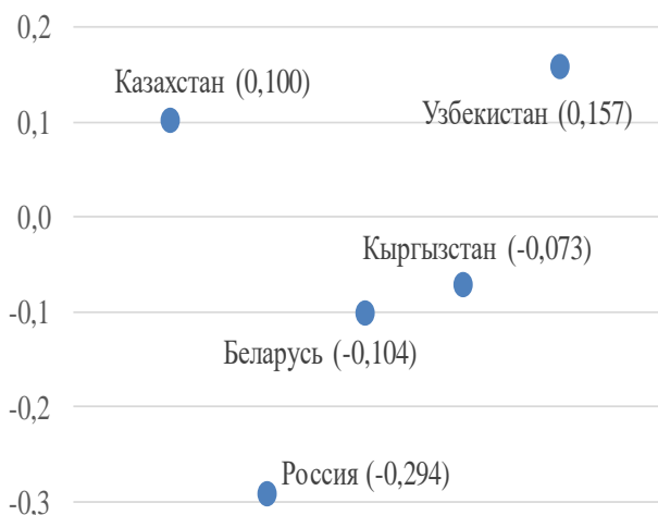
Рисунок — 1. Коэффициент корреляции между неравенством доходов и долей социальных трансфертов в странах СНГ*

*составлен авторами на основе источника [1-5]