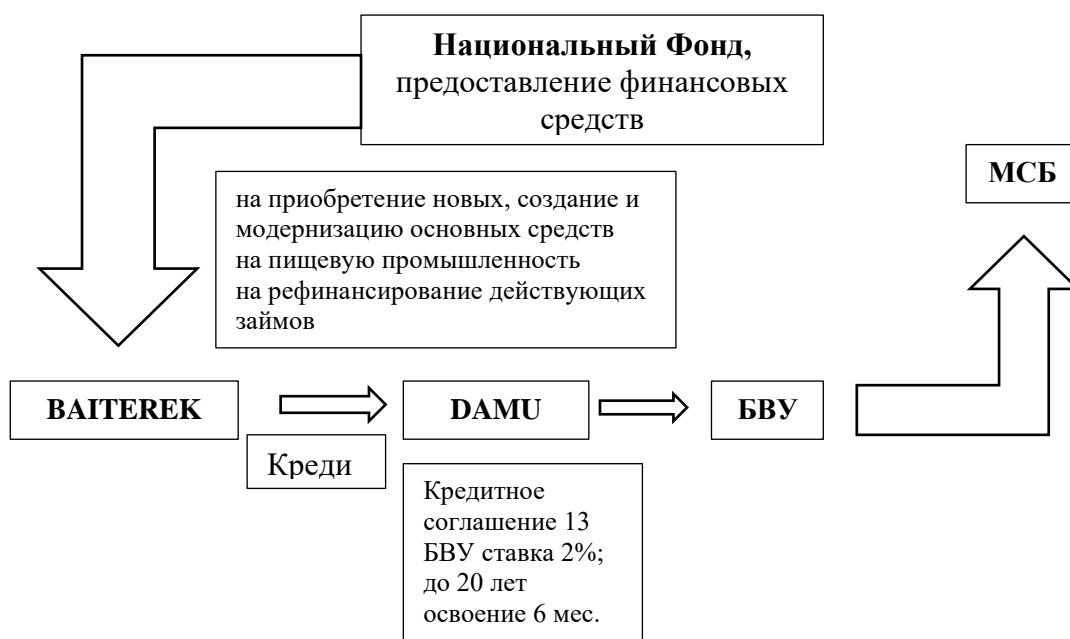
Рисунок – 2. Общий механизм реализации программы льготного финансирования

Поддержка предпринимательства в агропромышленном секторе реализуется государством через ряд механизмов: внедрение льготного налогообложения для участников рынка, выделение субсидий и обеспечение доступа к льготным кредитам, предназначенным для финансирования весенне-полевых и уборочных кампаний. Дополнительно, в Республике Казахстан предусмотрены меры поддержки для предприятий пищевой промышленности, реализуемые посредством программы льготного финансирования, представленной на рисунке 2: