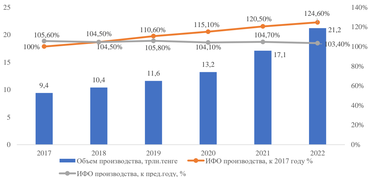
Рисунок 3. Объем производства продуктов обрабатывающей промышленности в 2017–2022 гг.

В 2017–2022 годах в стране производство обрабатывающей промышленности выросло почти в 2,2 раза с 9,4 трлн тенге в 2017 году до 21,2 трлн тенге по итогам 12 месяцев 2022 года. Большая часть произведенной продукции обрабатывающей промышленности относится к металлургии, производству продуктов питания, машиностроения и продуктов нефтепереработки (рисунок 3) [7].