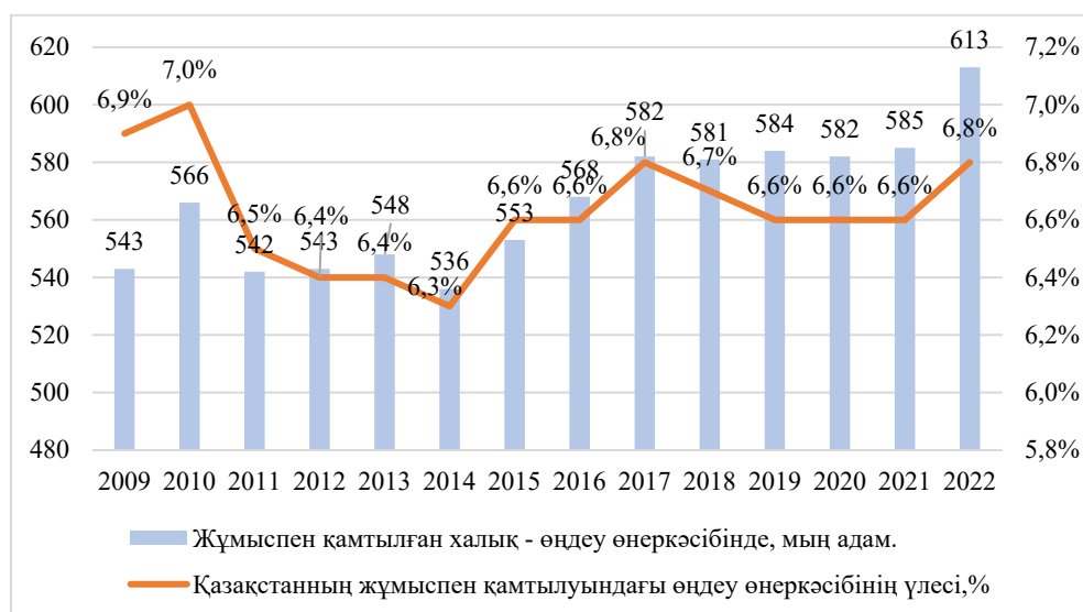
1-сурет. Қазақстан халқын жұмыспен қамтудағы өңдеу өнеркәсібінің үлесі*

Негізгі бөлім (нәтижелер мен талқылау). Зерттеудің келесі кезеңінде Қазақстан халқын жұмыспен қамтудағы өңдеу өнеркәсібінің үлесіне талдау жүргізілді (1-сурет).