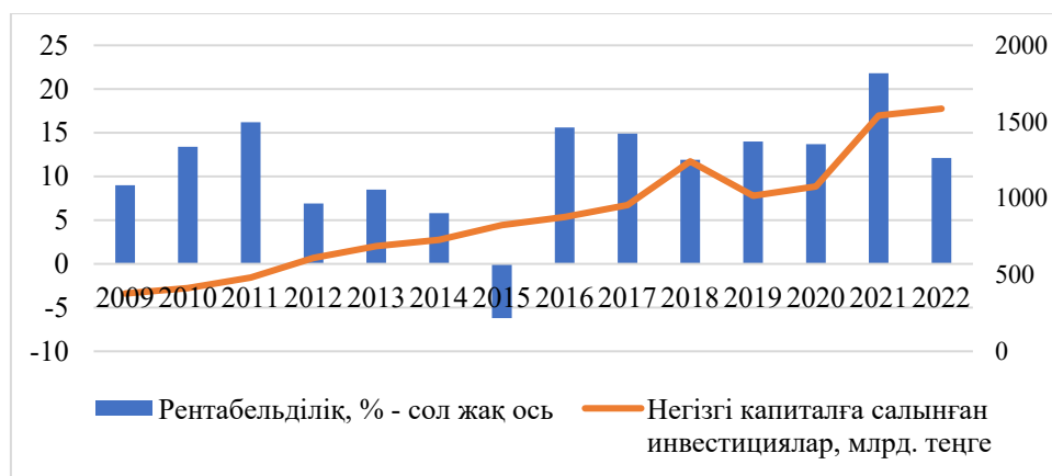
4-сурет. Қазақстанның өңдеу өнеркәсібіндегі 2009-2022 жылдардағы негізгі капиталға инвестициялар мен рентабельділік көрсеткіштерінің өзгеру динамикасы көрсетілген*

4-суретте Қазақстанның өңдеу өнеркәсібіндегі 2009-2022 жылдардағы негізгі капиталға инвестициялар мен рентабельділік көрсеткіштерінің өзгеру динамикасы көрсетілген.