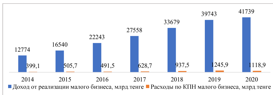
Рисунок 1. Доход от реализации малого бизнеса и расходы по КПП малого бизнеса, млрд. тенге*

96,3%. Число активных предпринимателей увеличилось на 2,1%. Рост производства собственной продукции позволяет малому бизнесу получать больше доходов от продаж: за семь лет годовой доход малых предприятий увеличился более чем в три раза и достиг 41739 млрд. тенге в 2020 году. В результате доля доходов малого бизнеса в общем доходе предприятий увеличилась с 29% до 47,2% (Рисунок 1) [9].