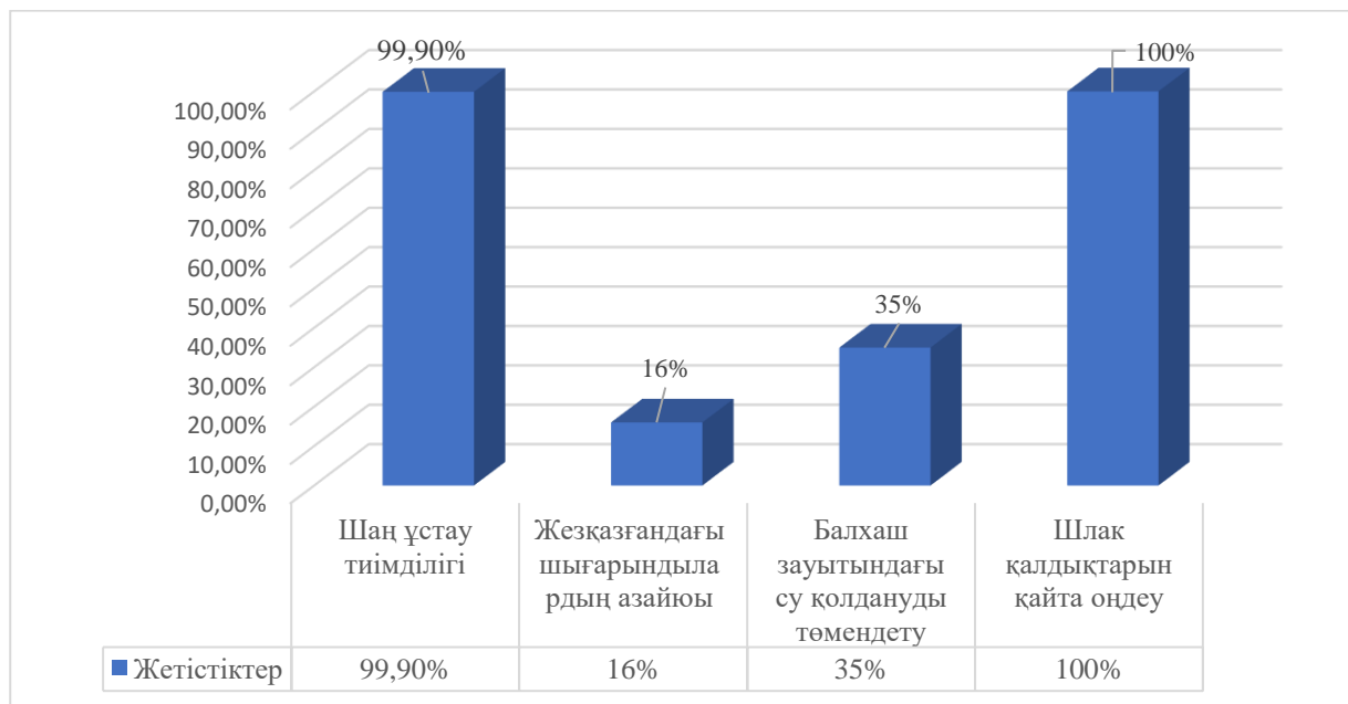
Сурет – 3. 2024 ж. «Қазақмыс» компаниясына эко-инновацияларды енгізудегі жетістіктер *[13] дереккөзі негізінде авторлармен құрастырылған

Қазақстандық компаниялардың мысалдары көрсеткендей, АМЖ енгізу мен ҚОТР және ҰДБ біріңғай цифрлық платформасы деректерді интеграциялау маңызды мәселені шешуге мүмкіндік береді- мерзімді өлшеулерден ағымдық уақытта шығындарды басқаруға ауысу. Дегенмен «ақпараттық алшақтықтар» әлемдік өнеркәсіптік алыптарға да тән. Айырмашылығы- жаһандық деңгейде бұл мәселе күрделі технологиялық құралдармен шешіледі: «жасыл цифрлық егіздер» (Siemens), AI-чат-боттар жеткізу тізбектерін басқару (Unilever).