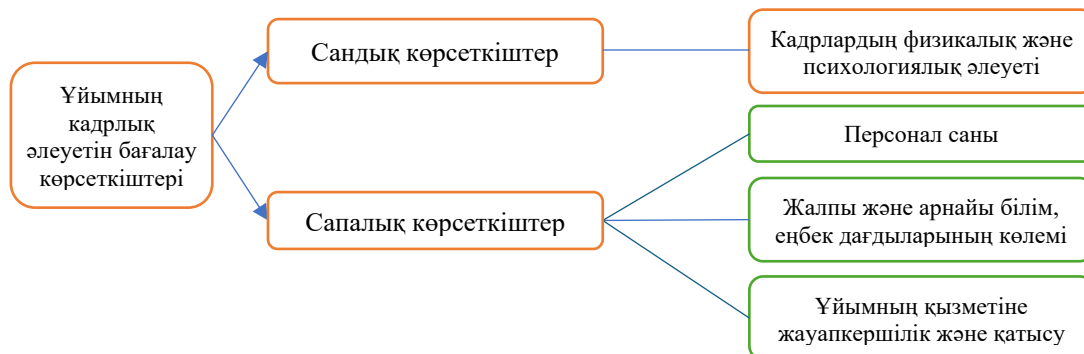
1-сурет. Ұйымның кадрлық әлеуетін бағалауға арналған көрсеткіштері*

Ұйымның кадрлық әлеуетіне талдау жүргізудің негізгі мақсаты – қажетті кадрлармен қамтамасыз етілуін анықтау және бағалау. Ол үшін кадр құрамының сандық және сапалық сипаттамалары өлшенеді. Ұйымның кадрлық әлеуетін зерттеудің тәжірибелі әдісі кадрлық жұмысқа әсер етуі мүмкін барлық көрсеткіштерді ситуациялық талдауды қамтиды. Алынған деректерді ескере отырып, әр қызметкердің жұмыс процесіне әсер ететін барлық тараптар түзетіледі. Кадрлық талдау тәжірибесінде ұйымның кадрлық әлеуетінің сандық және сапалық сипаттамалары бағаланады (1-сурет). Ұйым қызметінің барлық уақытында әртүрлі сыртқы және ішкі (басқару шешімдері, басқару стилі және т.б.) факторлардың әсерінен кадрлық әлеуеттің сандық және сапалық көрсеткіштері үнемі өзгеріп отырады.