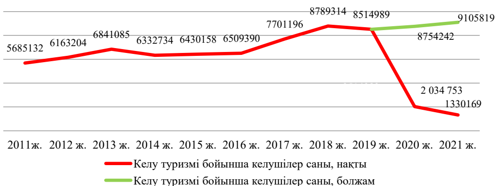
1-сурет. 2011-2021 жылдар аралығындағы Қазақстанға туристік сапармен келушілер санының салыстырмалы динамикасы, адам* * [7] дереккөзі негізінде авторлармен құрастырылған

2021 жылдан бастап карантин жағдайы тұрақталғаннан кейін туристік сапарлар қалпына келе бастады, сұраныс туындай бастады. Дегенмен, COVID-19 вирусының қарқыны күмәнді төмендетпеді. Шетелден келетін туристер саны азайып, еліміздің туризміне деген сұраныс келесідей көрініс тапты.